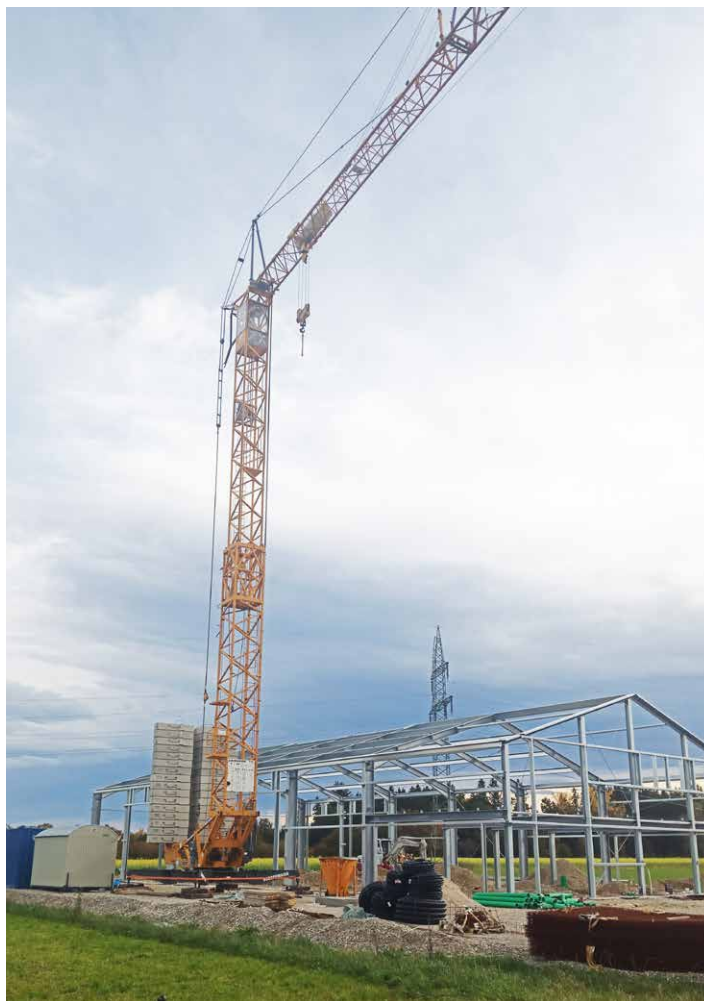
Baubeginn im Gewerbegebiet Gigling West

Seit Anfang Oktober wird im neuen Gewerbegebiet in Gigling gebaut. Die Firma Ett aus Tyrlaching baut hier eine neue KFZ-Werkstatt mit Reifenlager. Außerdem wurde Herrn Christoph Schaffner aus Traunreut die Baugenehmigung zur Errichtung eines Ausstellungs- und Bürogebäudes mit Betriebsleiterwohnung sowie die Errichtung einer Lager- und Produktionshalle erteilt. Weitere Anfragen liegen vor und werden derzeit geprüft.