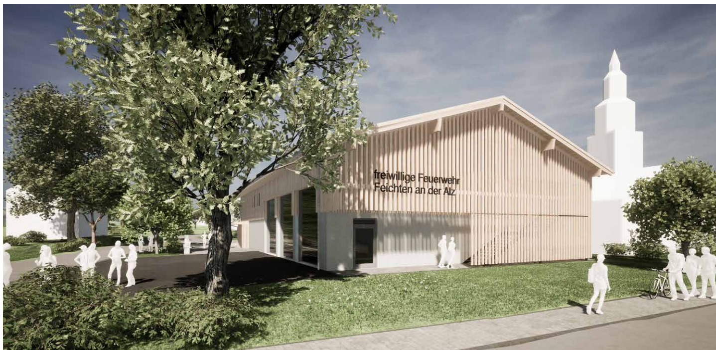
Außenansichten des neues Feuerwehrhauses (Modell)

Der Bau des neuen Feuerwehrhauses steht an und das von der Gemeinde erworbene Anwesen in der Hauptstraße 1 wird abgerissen um Platz für den Neubau zu schaffen. Nach der Durchführung eines Schadstoffgutachtens kann nun mit den Abbrucharbeiten begonnen werden. Diese sollen zeitnah durchgeführt werden damit die Bauarbeiten im zeitigen Frühjahr starten können.