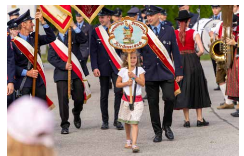
Die heimische Musikkapelle begleitete den Festzug