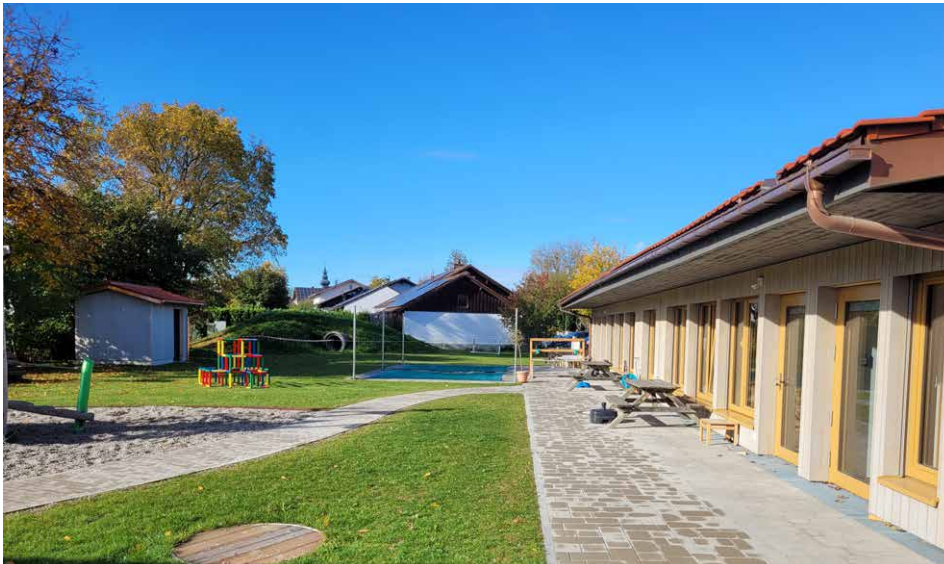
Der Neue Garten- und Außenbereich