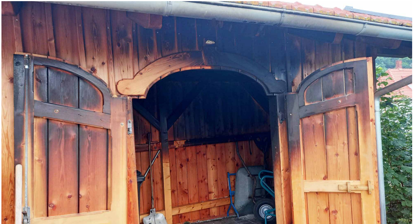
Das beschädigte Gerätehaus

Ein Raub der Flammen wäre ein Gerätehäuschen der Gemeinde Halsbach Anfang Juli geworden, wenn nicht der Schulbusfahrer beherzt eingegriffen und die Flammen mit dem Feuerlöscher seines Fahrzeugs gelöscht hätte. Ein schwerer Brandschaden bleibt dennoch an dem Holzhäuschen zurück. Die Gemeinde hatte das Häuschen an der Burgkirchner Straße gegenüber dem Gasthaus „Mitterwirt“ (am Mai-