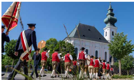
Auf dem Weg zur Kirche

Die Freiwillige Feuerwehr Kirchweidach feierte Anfang August das 150jährige Jubiläum mit aktiven und passiven Vereinsmitgliedern sowie zahlreichen Gästen.