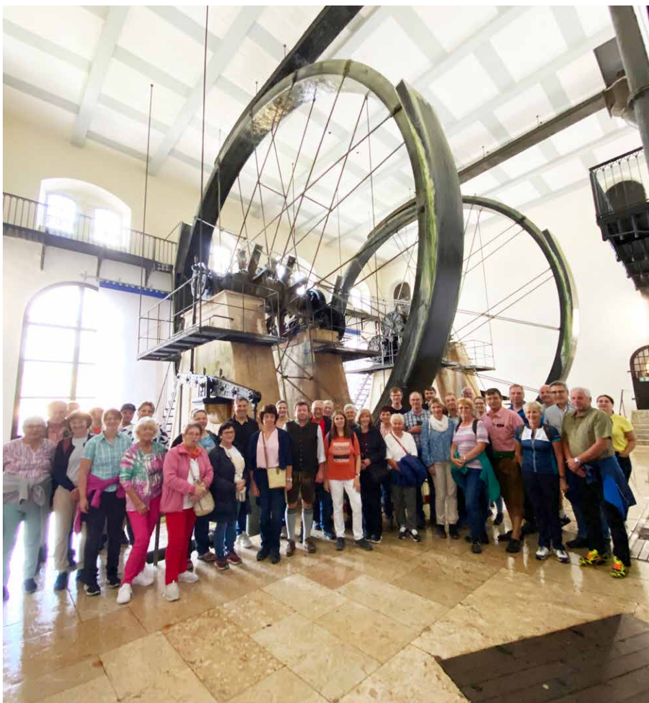
Beeindruckt zeigten sich die Teilnehmer von den sich ununterbrochen drehenden Wasserrädern in der Alten Saline.

Wieder über Tage schwebten die Halsbacher danach mit der nostalgischen Predigtstuhlbahn auf den 1614 Meter hohen Hausberg der Bad Reichenhaller. Die Ausflügler genossen die tolle Aussicht gemütlich auf der Terrasse oder bei einem Spaziergang auf dem Rundweg. Bei der Heimfahrt gab es einen Zwischenstopp in Pietling und mit einem gemeinsamen Abendessen klang der gelungene Ausflug gemütlich aus.