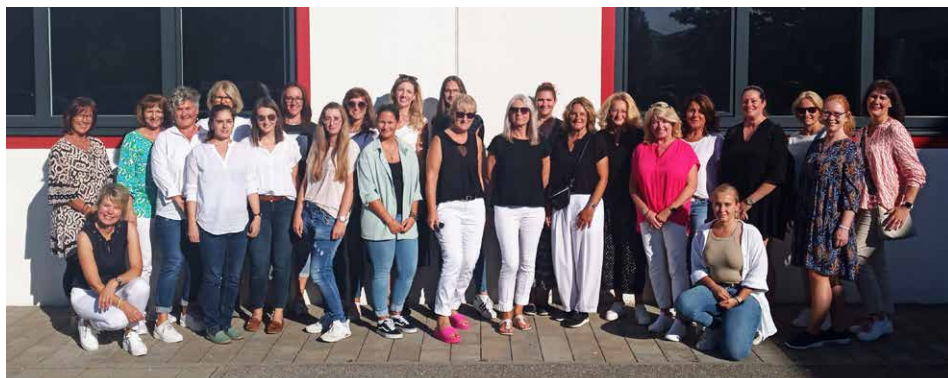
Das Bild zeigt die Teilnehmerinnen des Assistentinnen Treffens 2023

Am 20. September trafen sich am Nachmittag 26 Assistentinnen der Bürgermeister bzw. Landräte aus den Landkreisen Altötting und Mühldorf im Rathaus der Verwaltungsgemeinschaft. Das Treffen wurde vom Vorzimmer der VG organisiert und ausgerichtet. Nach einem kleinen Sektempfang und einer Begrüßung durch die Bür-