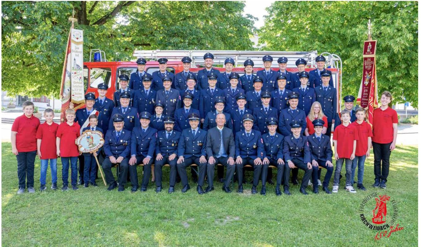
Mannschaftsbild FFW Kirchweidach