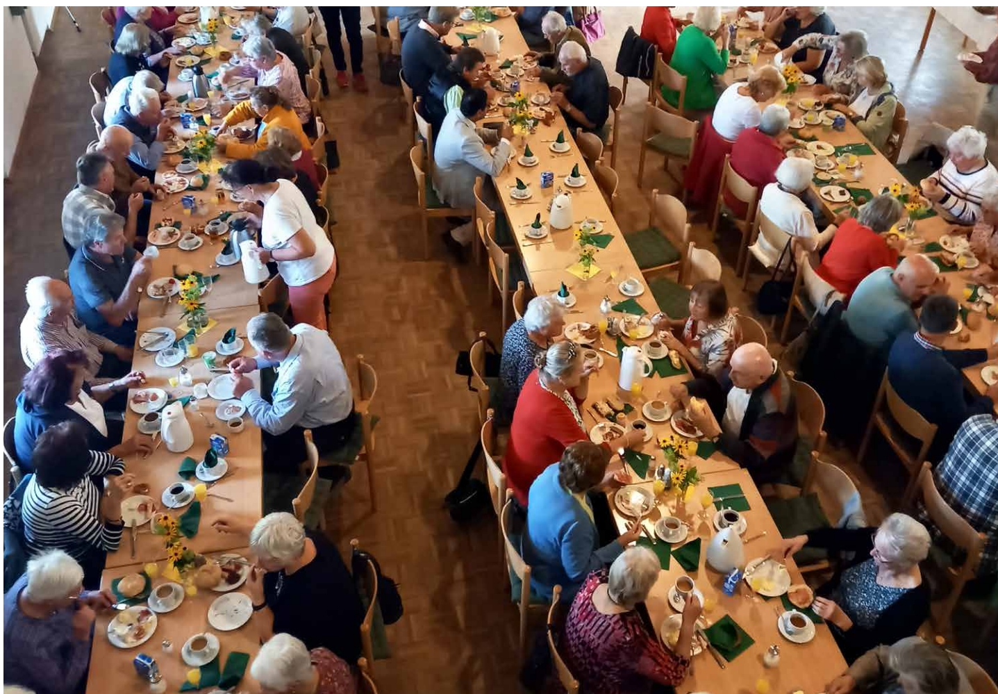
Feier zum Welttag der älteren Menschen in Oberbuch im Schützenheim