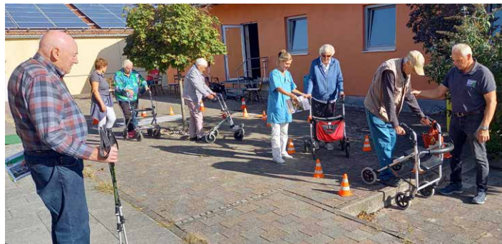
Teilnehmer des Rollator-Kurses am 11.10.2023