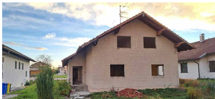
Die Abbrucharbeiten haben begonnen

Der Bau des neuen Feuerwehrhauses steht an und das von der Gemeinde erworbene Anwesen in der Hauptstraße 1 wird abgerissen um Platz für den Neubau zu schaffen. Nach der Durchführung eines Schadstoffgutachtens kann nun mit den Abbrucharbeiten begonnen werden. Diese sollen zeitnah durchgeführt werden damit die Bauarbeiten im zeitigen Frühjahr starten können.