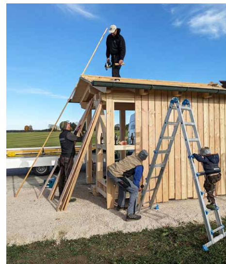
Das neue Bushäuschen in Mankham wird mit tatkräftiger Unterstützung aufgebaut

Es wurden 5 Angebote für ein Buswartehäuschen im ländlichen Stil mit einer Grundfläche von ca. 2 x 4 m eingeholt.