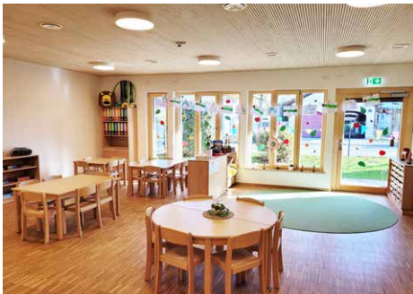
Der helle Aufenthaltsraum