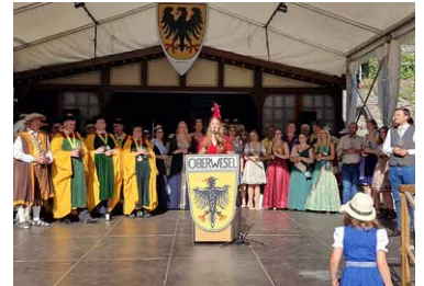
Begrüßung durch die mittelhessische Weinkönigin