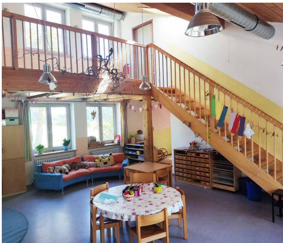
Die Innenräume im Kindergarten wurden neu gestrichen

Malerarbeiten an der Außenfassade und an den Fenstern geplant. Im Halsbacher Kindergarten werden derzeit 47 Kinder betreut.